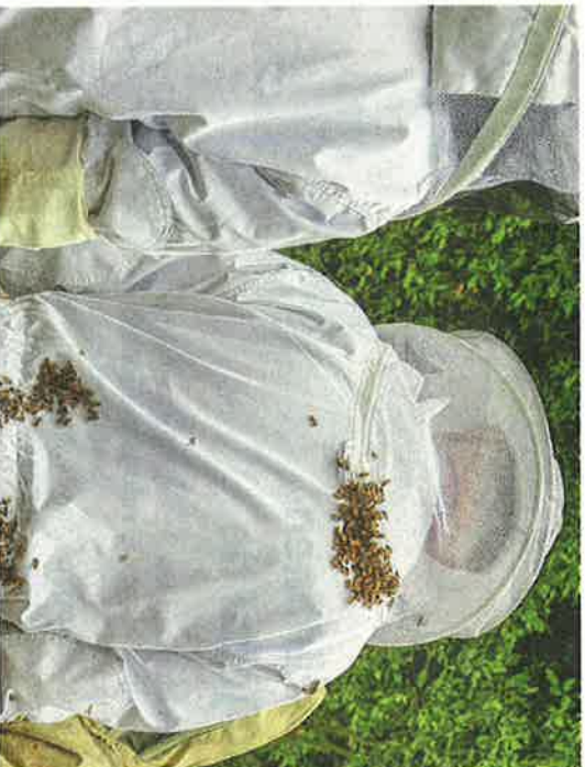
Kun keli on satelinen ja viljeä, mehiläiset aistivat lämmön esimerkiksi ihmisestä ja tarrautuvat silheen kiinni.