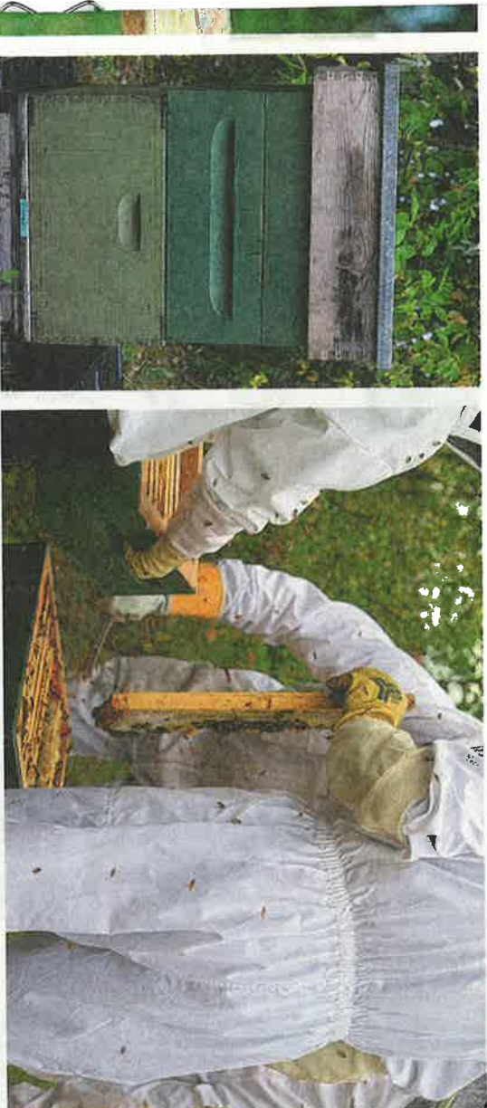
Pesä koostuu päällekkäin la- dottavista laatioista.