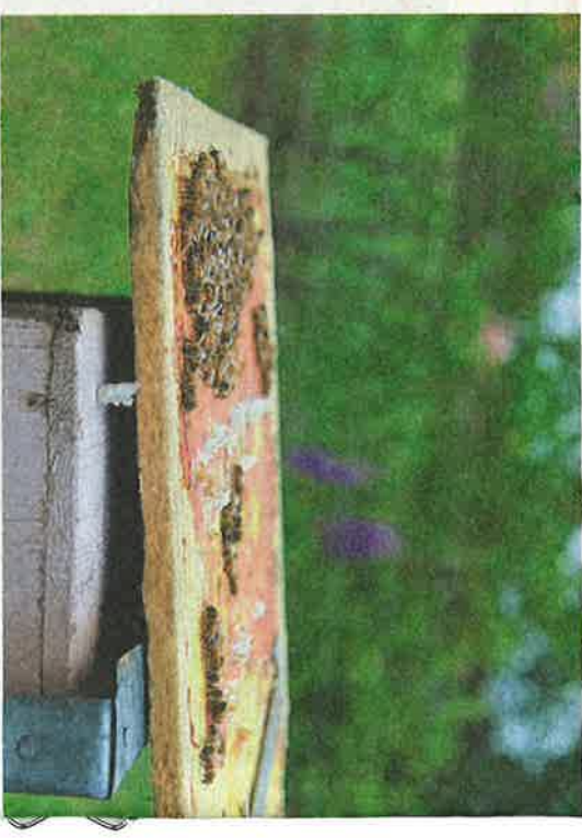
Normaalisti pesällä käytössä tutkitaan pesän ruokavarat, emollisuus ja mehiläisten määrää pesässä.