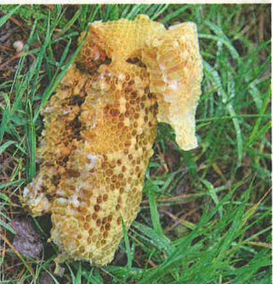
Kuhnurikennon leikkaus on keino poistaa varroapunkki mehiläispesästä.