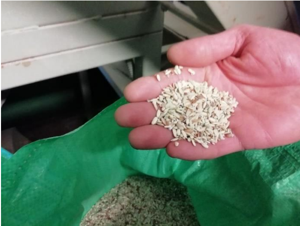
Kuorittua, puhdistamatonta riisiä,