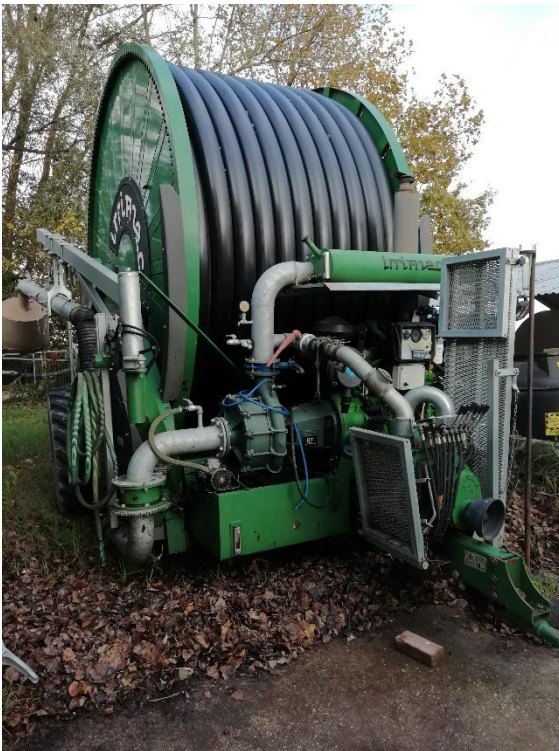
Tilan järeää kastelukalustoa.

Tällä tilalla käytiin katselemassa myös koneita; kuoretuman rikkoja ja pyörivä hara olivat sellaisia, joita ei osunut reitille Eimassa. Pellot vaativat kastelun, toisessa kastelulaitteessa oli 500 metriä johtoa, toisessa 350 metriä. Vuorokaudessa saa kasteltua seitsemän hehtaaria ja siirrettyä laitteet toiselle lohkolle. Myös täällä oli hehtaarikohtainen vesimaksu 100 €/ha, koska alue on Po-joen suistoa, muualla määrään perustuva maksu.