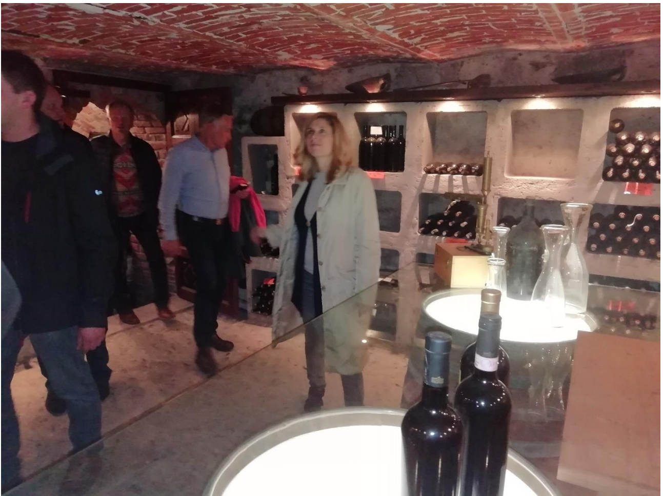
Anzivinon tilan sommelier esittelee viinien laadunvarmistusnäytteitä eri vuosilta.

Käymisen jälkeen viini tynnyroidään puolestatoista vuodesta kolmeen vuoteen eri kokosiin tammitynnyreihin. Nyt tilalla oli menossa viinien käymisvaihe. Tämä vuosi oli hyvä viinivuosi. Tilalla oli töissä isäntäväen lisäksi kolme työntekijää ympäri vuoden ja poimijoita palkattuna 10 henkeä. Kaikista valmistetuista viinieristä oli tallella laadunvalvonta-näytteitä erillisessä kellarissa. Viinin alkoholipitoisuus voi olla korkeintaan 15 %, jos yli, tuote ei ole enää viiniä.