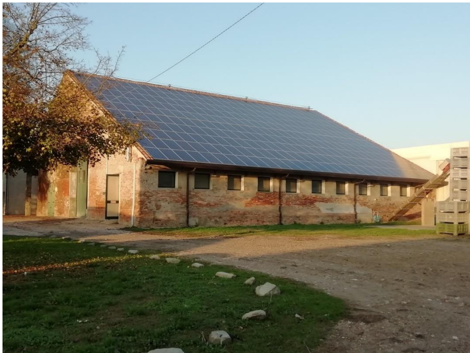
Tilan energian tuotantoa - varistorakennuksen aurinkopaneelikatto.

Luomutarkastuksia hoitaa yksityinen yritys, joka tekee kaksi vuosittaista tarkastusta ja lisäksi voi tulla yllätystarkastuksia