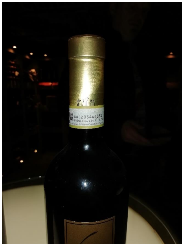
Pullon kaulassa alkuperän todistava numerosarja.

Riisitilan jälkeen käytiin Anzivinon viinitilalla Gattinaran keskustassa. Tilalla kuultiin esitys toiminnasta ja käytiin viinikellarissa sekä tilan omassa viinikaupassa. Eri alueitten viineillä on omat laatumerkintänsä ja Gattinarallakin on oma viini, jonka aromin ajatellaan tulevan maaperästä. Tilalla oli aiemmin grappatislaamo, mutta nyt tiloissa toimi ravintola. Tilalla oli 4 hehtaaria viinitarhaa Gattinarassa ja 2 hehtaaria muualla, vain Gattinarassa viljellystä viinirypäleestä voidaan valmistaa Gattinara-viiniä. Gattinara-viinin valmistusta valvotaan siten, että viljelijöiden on ilmoitettava osuuskunnalle paljonko rypäleitä poimittiin ja määrän mukaan tila saa sitten numeroidut pullot eli viiniä ei voi tehdä enempää mitä rypäleitä tuli.