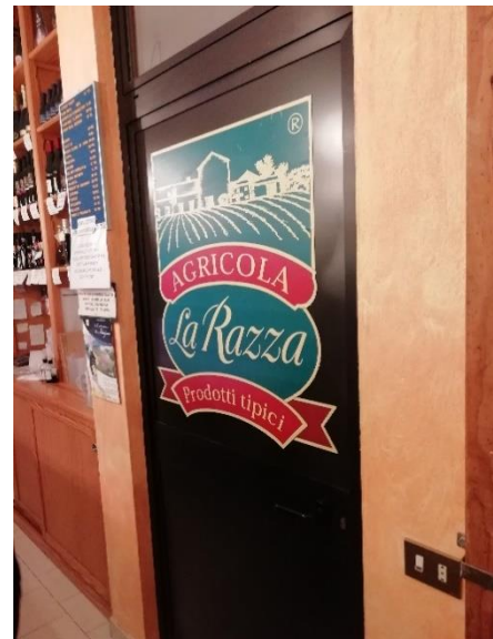
La Razza'n tilamyymälä