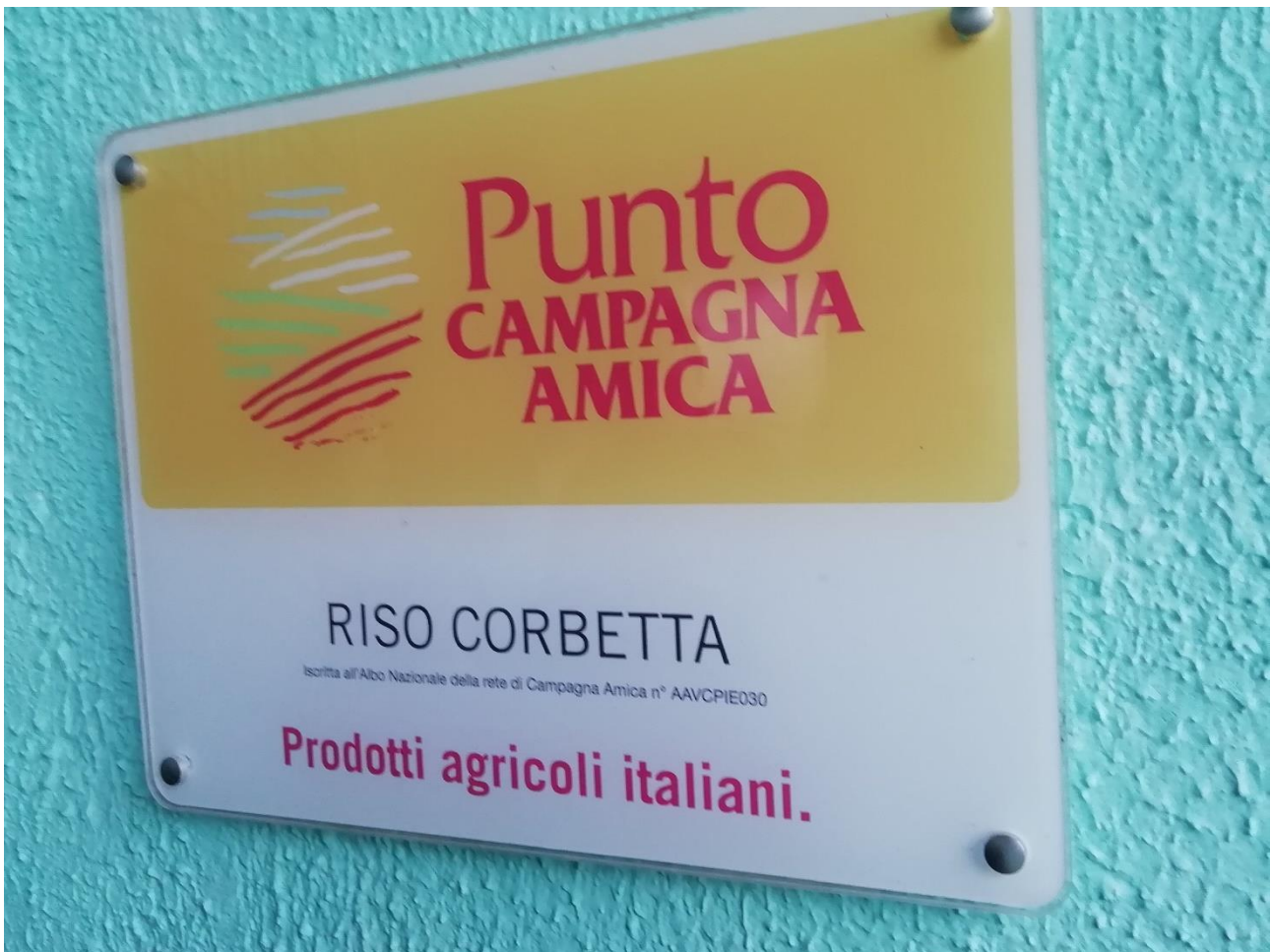
Tilamyymälän seinäkilpi "Italialaista, Corbettan tilan riisiä"

Osa riisistä pakattiin nostalgisiin kangaspusseihin, osa suojakaasun kanssa muovipusseihin. Tilalla oli oma pieni myymälä, josta riisin lisäksi voi ostaa gluteenittomia leivonnaisia. Asiakkaina ovat naapurit ja ravintolat. Tilan nettisivut https://risocorbetta.weebly.com