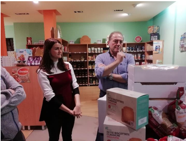
Mamey-kaupan yrittäjät isä ja tytär.