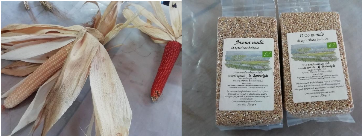
Oikealla "Maajussin maissi".