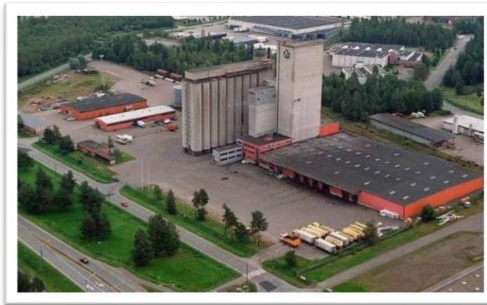
Seinäjoki, 240 000 T