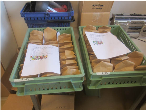
Härkäpavun siemenet punnittuna ja järjestyksessä kasvitautitorjunnan ja kylvötiheysvertailun ruutujen kylvöä varten.

Lupiinin siemenestä on ollut pulaa, mutta Jokioisille saataneen viisi lajiketta pienruutuihin. Tiedossa on myös pari viljelijää, jotka aikovat kylvää lupiinia peltomittakaavassa. Ehkä päästään katsomaan niiden menestymistä myöhemmin kesällä Hukka-hankkeen pellonpiennartilaisuuksissa.