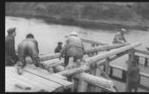
Kaivannon, eli Auneksen sillan kootaan tulvien jälkeen. Myös Auneskylästä osallistui miehiä työhön.

Samana vuonna saatiin vielä kesä-paisuntakin, joka kasteli seipäillä olleet heinät ja kaatoi kasvussa olleen viljan. Näitä tulvatuhoja tuli vuodesta toiseen.